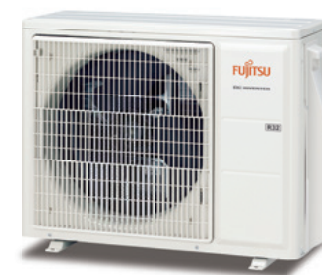
ASY 25 -35 UI-KP